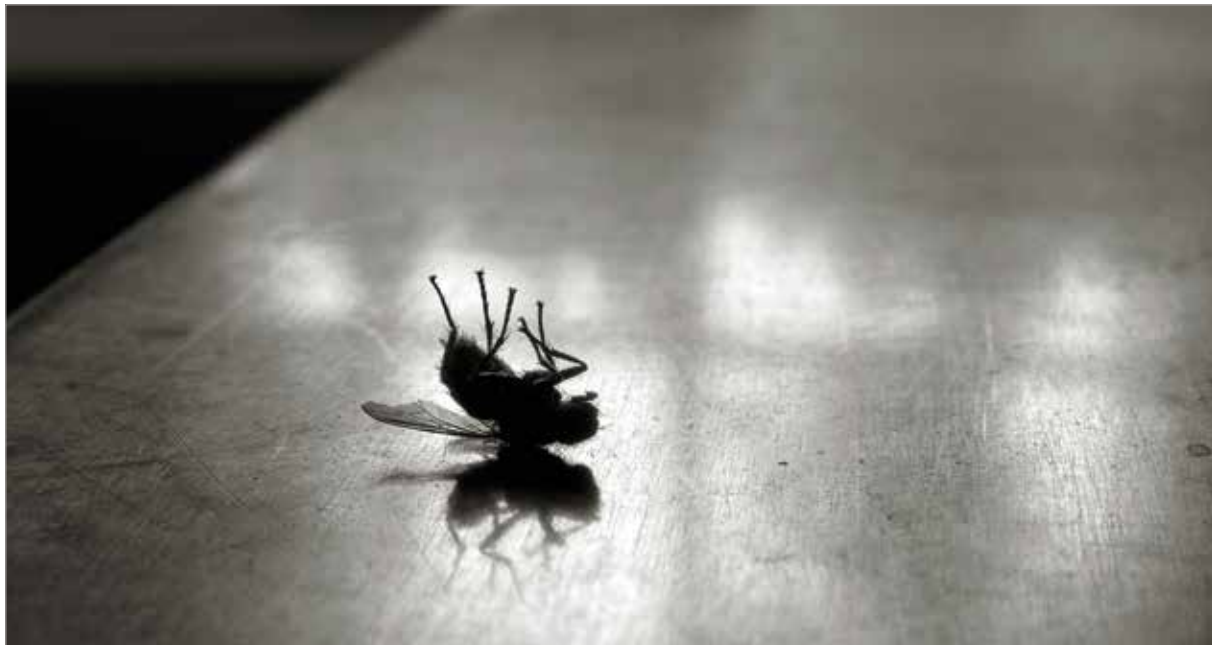
Fluga på rygg, 2013, utsnitt

Temat i hans senaste fotobok Domestica är att undvika hemmablindhet. Då man ser samma ting eller landskap gång på gång, måste man fördjupa iakttagelsen för att se det väsentliga. Serien Domestica handlar om förhållandet mellan landskapet och ljuset samt människans samverkan med sin omgivning. Bilderna, som är resultat av konkreta iakttagelser, förmedlar småskaligt och intimt årstidernas växling och livets kretsgång.